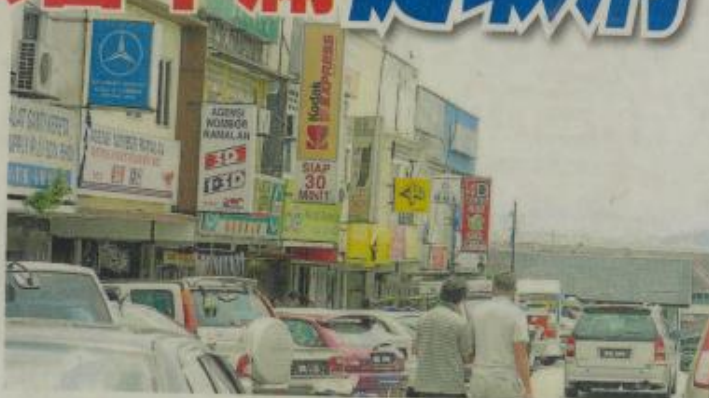
八打灵再也市政厅为杜绝层出不穷的申请广告牌照欺骗案，而规定商家只能自行或派能出示授权书的雇员前往市政厅办理手续，引起雪隆广告公会的不满。

他指出，此项举措为广告业者和商家带来广泛影响和麻烦，因此他已向雪州行政议员刘天球反映，并将与他择日前往市政厅以了解此事及取消该项政策。