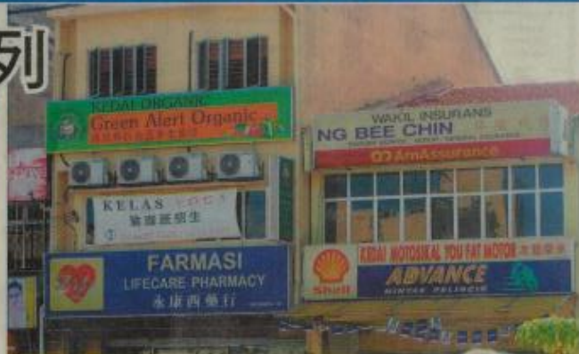
廣告業者聲稱，語文出版局除了規定國文商業說明字體必須比其他語文稍大外，其他語文只能排在國文的下方。

(吉隆坡訊)雪隆廣告公會業者聲稱，他們今年3月初到市政局申請商業執照時，被告知必須先通過國家語文出版局的審查，方能獲得批准。此外，有關當局針對廣告招牌設計的新規格及指示，也引起廣告商的不滿。