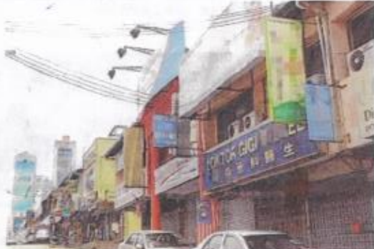
广告业者如今面对各级政府不同的标准，行业也苦无头绪。