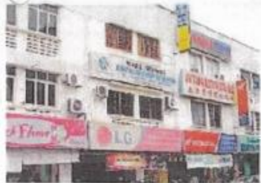
广告商上的马架话字越来越多限制，造成广告商困扰。（吴令安）