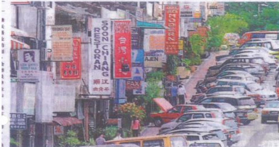
国家语文出版社诸多限制，扼杀了广告设计的创意。

面的研究。 “反贪会官员召开 会议时，国语专家不要 为得到执照而请国语 专家。但国语专家开会 化中请执照的程序才是 正确之道。” 他呼吁新山市议 员讨论广告业面对的 上述困境，以便一起在 市议会上提出动议。