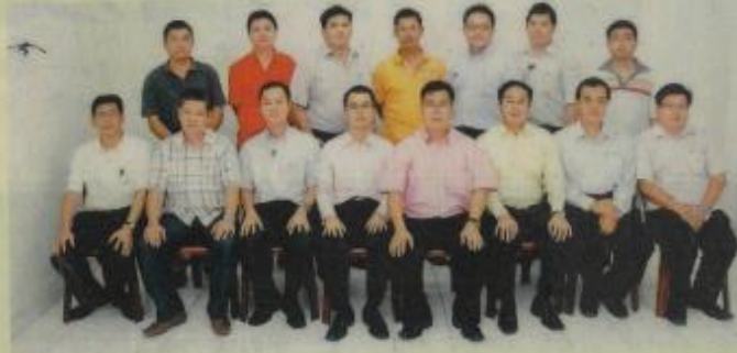
雪隆廣告公會新屆理事。