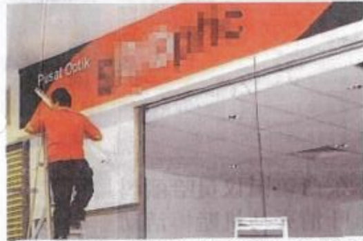
郑文局于各商家所设立的广告招牌，其中严格管制马来文字，但都标准不一。

郑卓东表示，新加坡政府对于广告业的限制，使得广告业的发展受到阻碍。他指出，广告业的发展已受到许多阻碍，广告业的发展已受到许多阻碍。