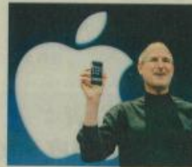
苹果电脑创办人史蒂夫贾伯斯了解一切领导与企业文化，大多起源自领导人上行下效。

他在介绍公司状况时，从LV的皮包中拿出一个特别颜色，镶了金框的笔记本电脑，一再强调他经营时特别注重节俭与实务。我平常不大以貌取人，也不会轻易的让第一印象主宰。但是这次我真的听不下去。