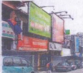
大型广告牌进驻商店楼上的窗户。