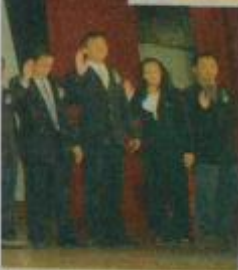
新的里程碑。言带领公会会员迈向理事宣誓就职，并暨柔佛州广告同业公会在莫泽浩见证下。