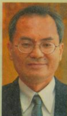
●刘天球：除非举报者应举出具体证据，否则我们不能随便相信别人的指责。

另一方面，安邦再也市议会主席莫哈末耶谷受《星报》询问时对此事感到震惊，并指市议会并没有所有中选中议员的背景。