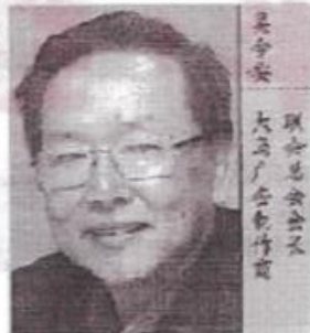
吴守安 马来西亚广告制作商联合会总会会长