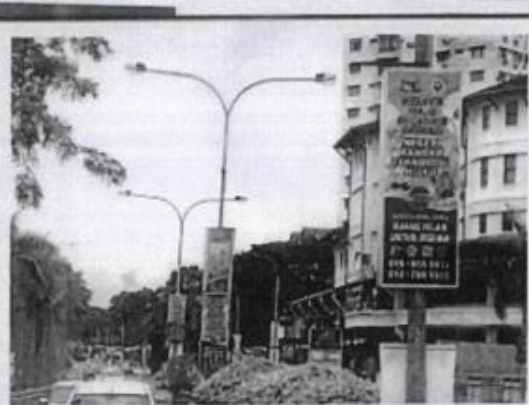
由市政厅指定广告业承包商所装的灯箱广告目前覆盖甲市电灯柱。