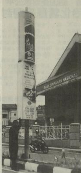
馬六甲市議會委任一家公司以壟斷方式經營3千枝廣告燈柱。

「為何這些地方政府在過去可以出租燈柱，以便讓商家張掛布條，收取租金作為收入；如今卻將它私有化，讓一家公司只須付出10萬令吉便能控制市場。」