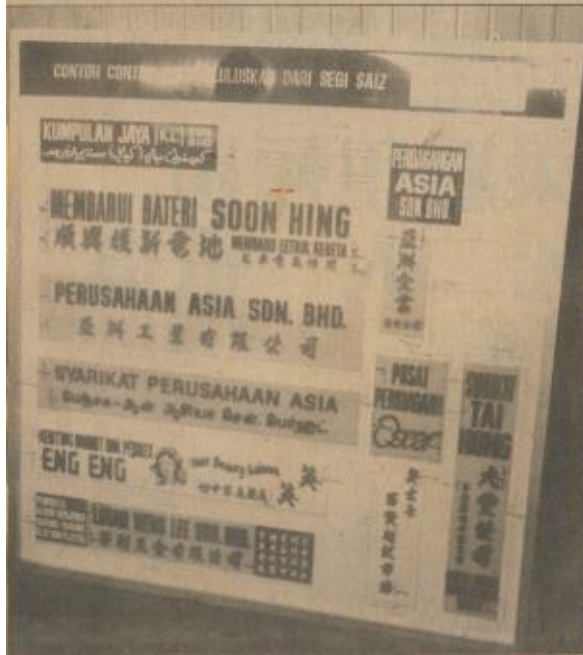
吉隆坡市政局在八六年批准九個標準廣告招牌樣本。

他也說，政府擬使各州首府的廣播中央系統化，不過所需的款項大約是四十億元。提到各縣議會主席及副主席將為全職者及可由政黨人士擔任事，他表示沒有什麼不妥。有錫蘭議會正副主席職位改為全職及可由政黨人士或其他人士擔任事，已在今天的會議中提出討論。 較早時，部長在主持會議時強調，由於地方政府理事會是在聯邦憲法下設立的一個機構，它所通過的一切決定適用於中央政府及州政府。他表示遺憾一些州政府沒有遵從理事會的決定，反而採取與理事會相反的條例。 他希望各方糾正這種現象，一切行動都遵照憲法。