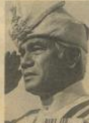
最高元首阿赫蘭沙

首相拿督斯里馬哈迪醫生、夫人拿汀亞蒂醫生、政府秘書長丹斯里沙烈胡丁等亦出席晚宴。