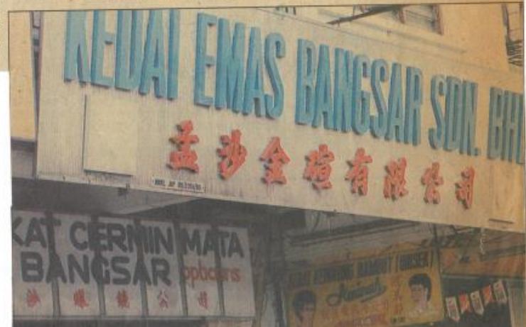
这是目前一些高号的招牌样式。

根据一名官员指出，单是各州首府，就需要动用四十亿元来提供完善的中央系统化的化粪池。